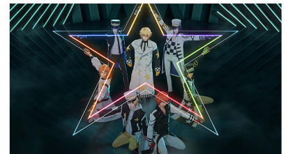
うたの☆プリンスさまっ♪ 10th Anniversary CD ©SAOTOME GAKUEN